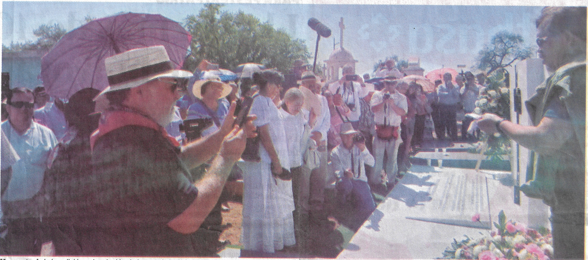
Momento de la bendición y develación de las tumbas de los estudiantes que murieron hace 50 años en la localidad sonorenses de Tesopaco.